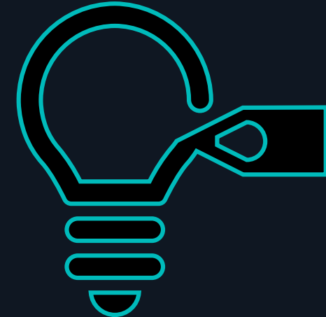
Piszemy rynek na nowo Sukces transformacji