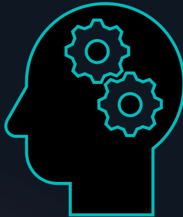
Zarządzanie zmianą Świadomy odbiorca